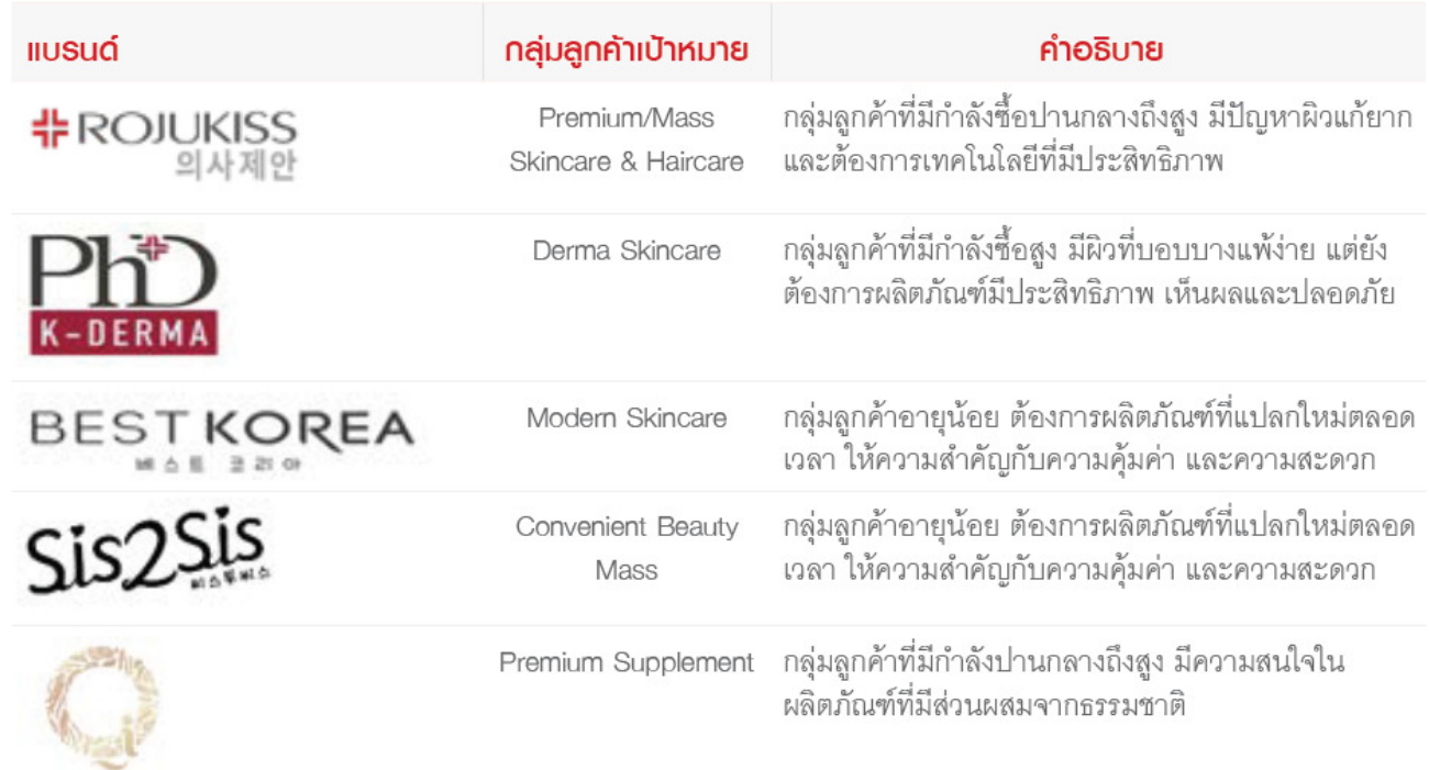
Figure 2: Brands under KISS