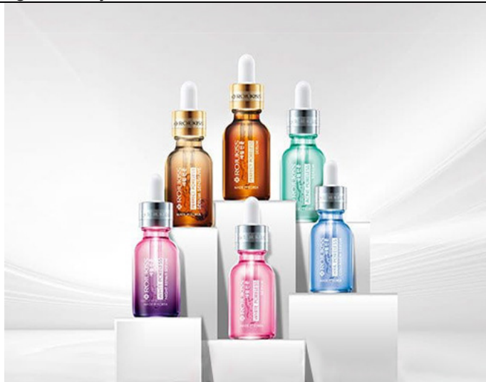
Figure 3: Rojukiss Serum