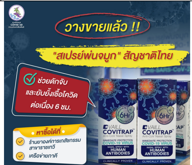
Figure 4: COVITRAP